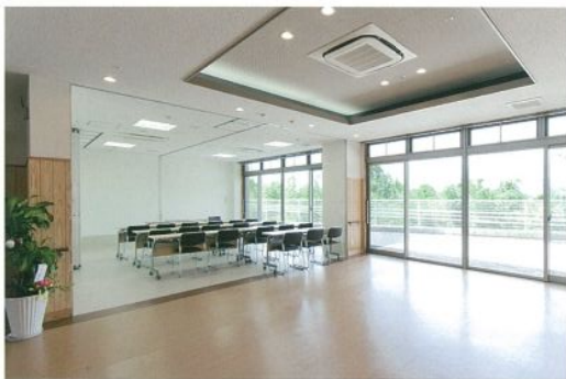
■ 明るく開放的なエントランス