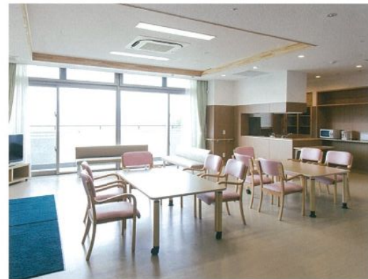
■ キッチン・リビング・ダイニング 明るく家庭的な雰囲気でお過ごし頂けます