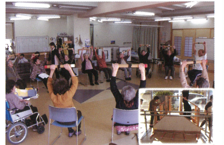
集団でいきいき体操！これでバッチリ！