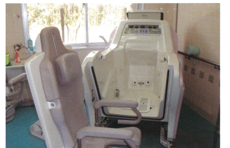
寝たきりの方でも安心して入浴できます