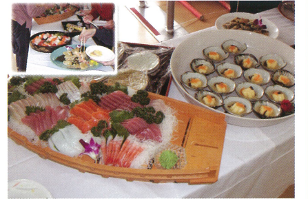
おいしいと好評のバイキング