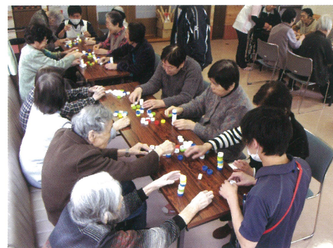
職員と一緒に楽しんでいるレクリエーション