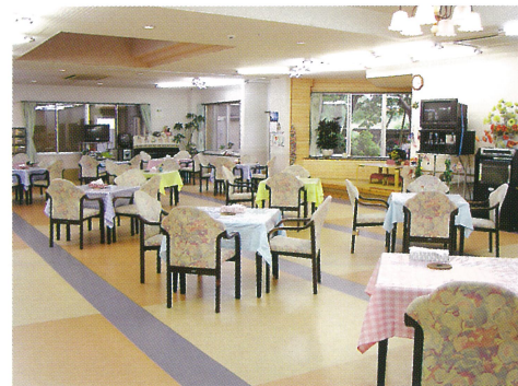
食堂 かたらいといこいの場